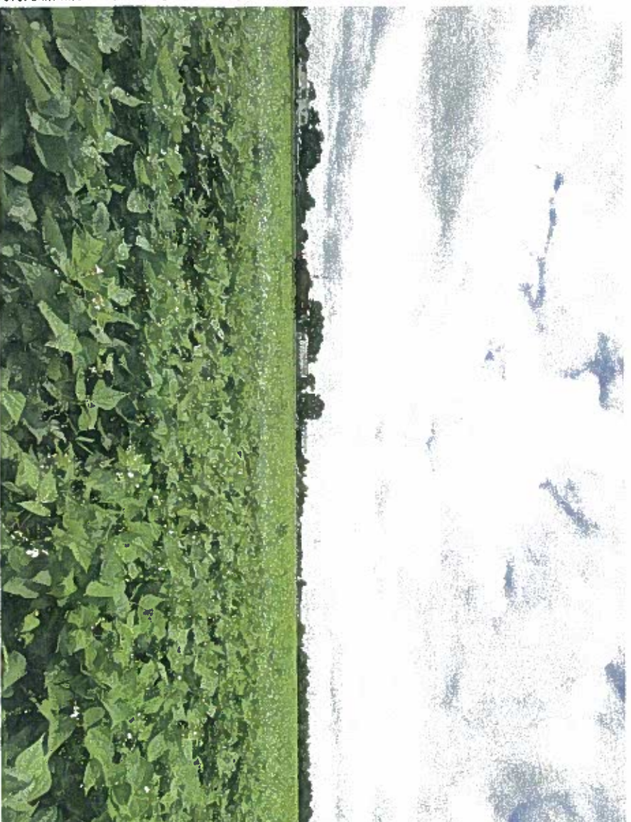
Pal aan de A73 ligt het landbouwoortwikkelingsgebied waar het Nieuw Gemengd Bedrijf ontwikkeld moet worden. Op deze locatie komen het pluimveebedrijf en de bio-energiecentrale. Het varkensbedrijf ligt 2 kilometer verderop.

wel alles onder een vergrootglas.” De tegenstanders van het project hebben zich verenigd in Behoud de Partel. Deze club strijdt overigens niet alleen tegen de komst van het NGB, maar tegen alle – in hun ogen – ongewenste grootschalige ont- wikkelingen in het buitengebied van Noord-Limburg. Bij het protest tegen het NGB hebben zich inmid- dels ruim 30 deelnemers uit de buurt aangesloten.